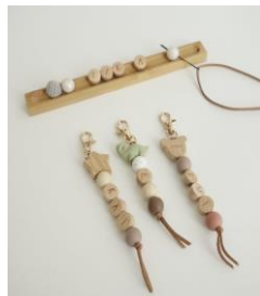
オリジナルキーホルダー作り グッドウェイ/エルゴベビー