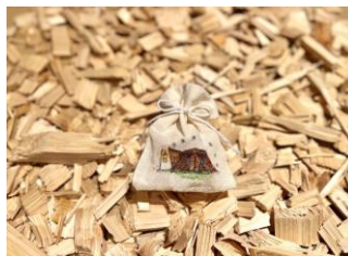
オリジナルサシェ作り Snow Peak LIFE BIOTOPE STORE