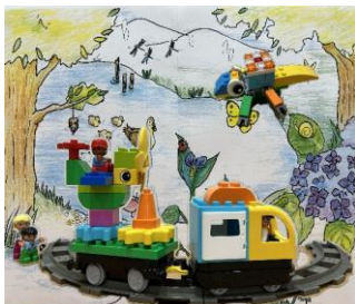
レゴブロックでものづくり体験 レゴスクール