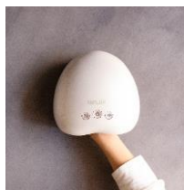
ハンドマッサージャー