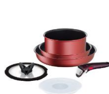
フライパンセット