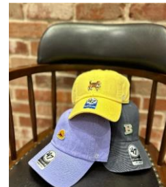
オリジナルカスタムキャップ作り フォーティーセブン