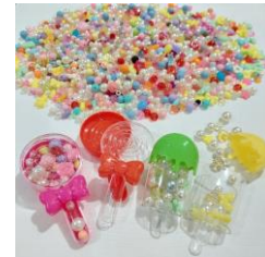
カラフルビーズ詰め放題 マーノ クレアール