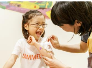
フェイスペイント PLAY! PARK ERIC CARLE