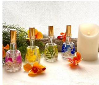
アロマ香水とチャーム作り エイチ・アイ・エス