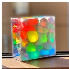
スタンドグラス風 「光のはこ」作り 好奇心の部屋