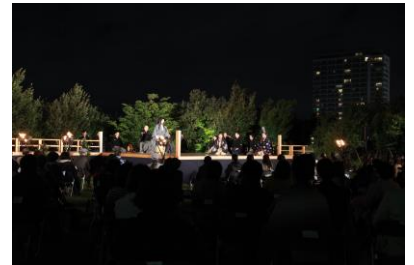
「二子玉川ライズ薪能」の様子（2022年撮影）

上演演目 狂言：寝音曲（ねおんぎょく）／能：船弁慶 前後之替（ふなべんけい ぜんごのかえ）