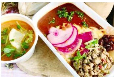
ポワル (オムライス)