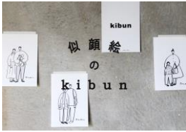
似顔絵のkibun (似顔絵) 出店日程：4/29～5/2

大人も子ども一緒になって楽しめる多彩なワークショップを集めた「あそぶの教室」を今年も開催。大人気のTOYPスケース作りや、カメラ作り、コインケース作りなど、ゴールデンウィークの思い出にぴったりな、さまざまなあそび体験を提供します。