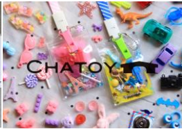
CHATOY-NEO緑日- (TOYPスケース) 出店日程：4/29～5/5