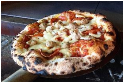
RUBBER TRUMP (ピザ)

バラエティ豊かでおしゃれなローカルフードトラックが大集結する「YUM YUM MARKET」。今年は、ハンバーガー、エスニック料理、コーヒー、スイーツまで、全11店舗の出店が決定。思いっきり遊んでおなかを満たす、バラエティ豊富なフードが楽しめます。