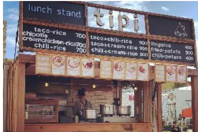
lunch stand tipi (タコライス)