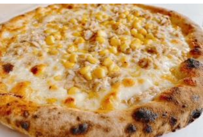
コルクオーレ (ピザ)