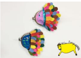
YellowPony (お財布作り) 出店日程：5/3～5/5