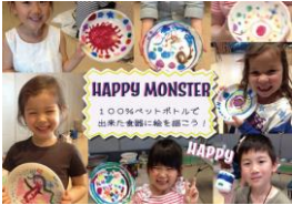
HAPPY MONSTER (エコメイト) 出店日程：4/29～5/3