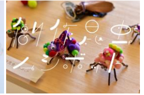
ザリガニワークス (創作昆虫ムシボット) 出店日程：5/4～5/5