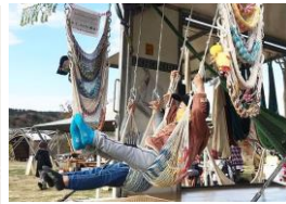
里山ハンモック (ハンモック作り) 出店日程：4/29～5/1 5/3～5/5