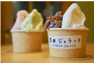
吉田ジェラート (アイスクリーム)