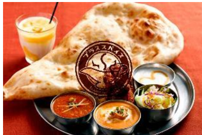
プラススパイス (カレー)