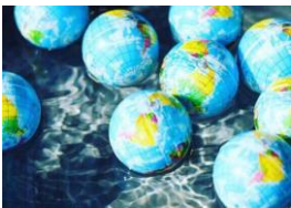
ちきゅうすくい (ちきゅうすくい) 出店日程：5/2～5/5