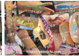
井上ヤスミチ (ボディペイント) 出店日程：4/29～4/30 5/2～5/3