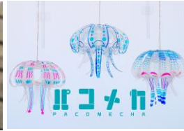
パコメカ (モバイルクラゲ作り) 出店日程：4/29～5/1