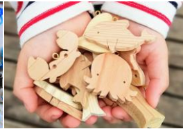
こぼと製作所 (木工雑貨) 出店日程：4/29～5/1