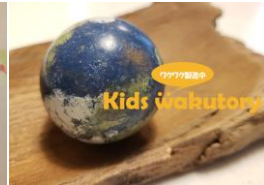
泥だんごプラネット (光る泥だんご) 出店日程：5/4～5/5