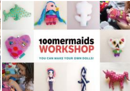
100mermaids workshop (ぬいぐるみワークショップ) 出店日程：5/1～5/5