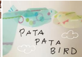
mameritsuko (ペーパーアイテム) 出店日程：4/29～5/2