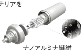
ナノアルミナ繊維