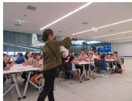
[紙ヒコーキ教室の様子]