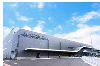
[あいち航空ミュージアム外観]