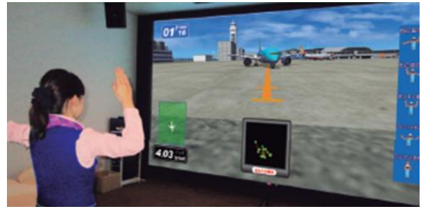
[旅客機を誘導してみよう！（マーシャラー体験）]