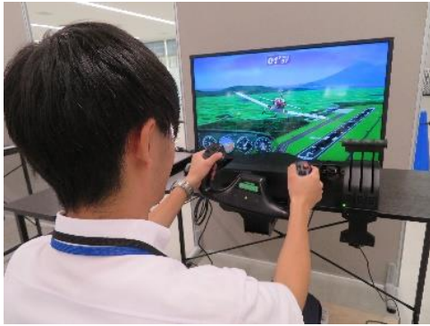
[パイロットになろう！（操縦体験）]