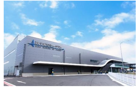
[あいち航空ミュージアム外観]