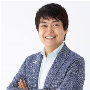
ドローンファンド代表パートナー