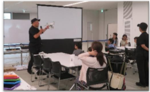
[過去のプログラミング教室の様子]

※あいち航空ミュージアム Web サイトにて事前申込みが必要です（12月上旬予定）。