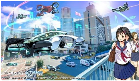
[イラストパネル(例)]