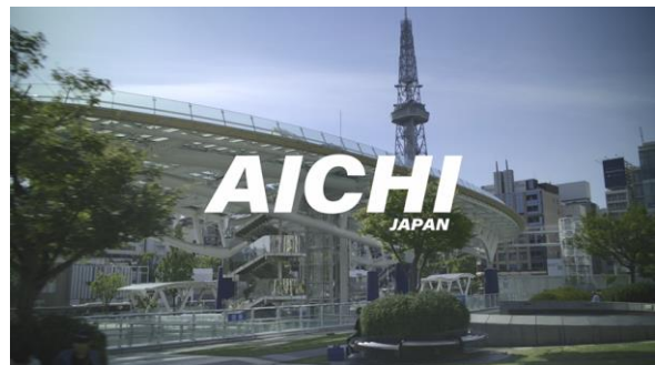
② バージョン ディープ [ver.DEEP] AICHI Japan in 8K