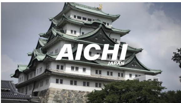
① バージョン ポップ [ver.POP] AICHI Japan in 8K