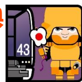
リニモ1日乗車券特典 ピンバッジ

リニモ1日乗車券提示で 先着600名様に あいち家康コラボ ピンバッジプレゼント!