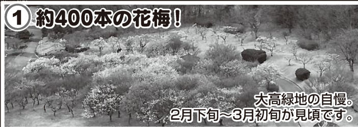
大高緑地の自慢。 2月下旬~3月初旬が見頃です。