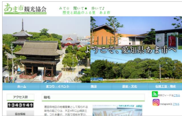
【リニューアル後のサイト画面】