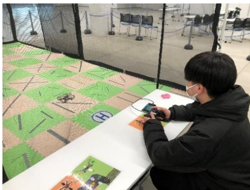
【ドローン操縦体験の様子】