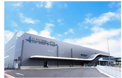
[あいち航空ミュージアム外観]