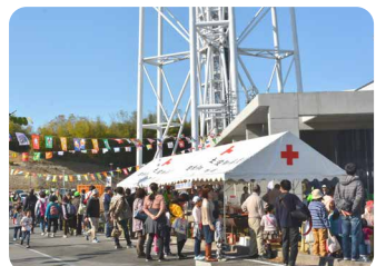
瀬戸市デジタルまつり

瀬戸口駅 ▶ 仙壽寺 ▶ リサーチパークセンター ▶ 瀬戸市デジタル「せとの里」 ▶ ふれあい市場 ▶ 公園駅 ▶ 愛・地球博記念