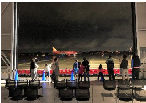
[大扉一部開放の様子]