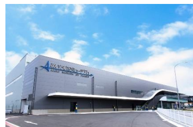
[あいち航空ミュージアム外観]