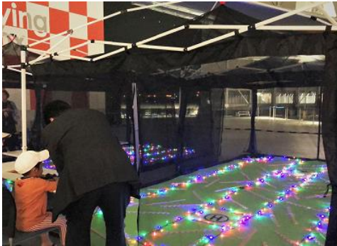
[ドローン体験 夜バージョンの様子]