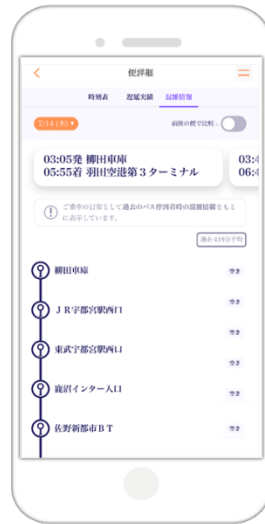
混雑実績の表示 (過去4回分平均)