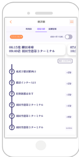
運行実績の表示 (過去4回分平均)