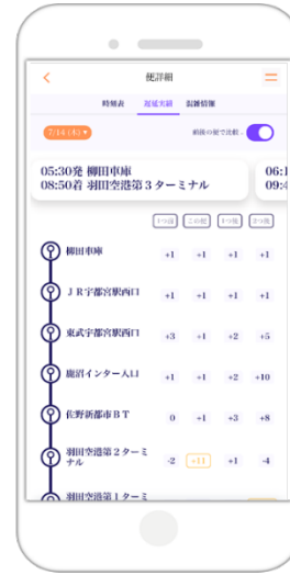
前後の便との比較 (運行実績・混雑実績)