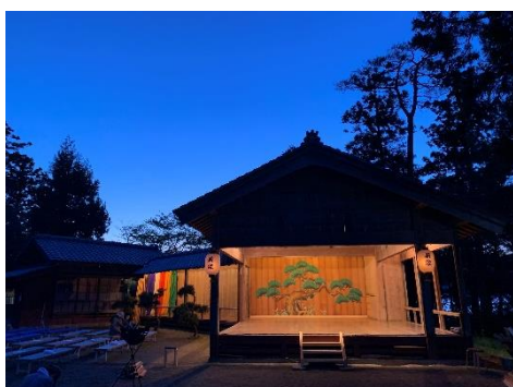
< 椎崎諏訪神社 能舞台 >

能の大成者 世阿弥に縁を持ち、江戸時代に広く発展を遂げた能の島 佐渡。 地域に根付いた能文化は、現在も大切に受け継がれています。 薪能鑑賞入場料と往復乗船代と宿泊がセットになったパックでお気軽に佐渡の 伝統文化に触れてみませんか？