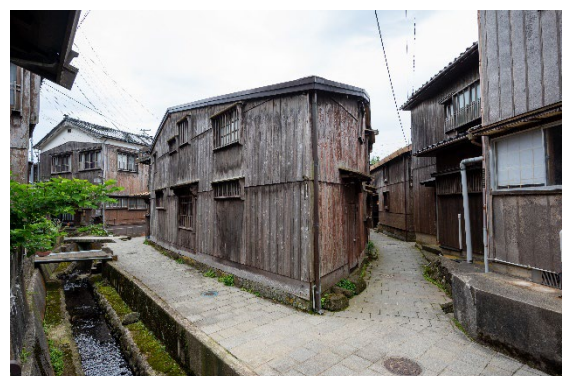
宿根木集落 *小木港から自転車で約20分