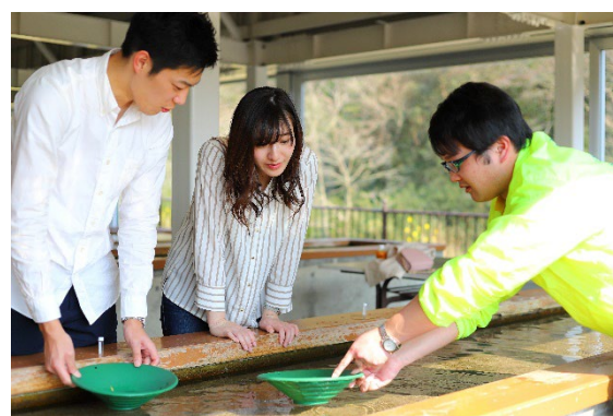
砂金採り体験（佐渡西三川ゴールドパーク） *小木港から自転車で約40分