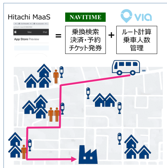
図 3. AI デマンドサービスの配車と乗換検索における役割分担イメージ

本システムでは、バーチャルバス停（VBS／標柱を置かない乗降場所）を多数設定し、利用者の乗車希望場所と目的地（降車希望場所）に対して、最適な運行経路（ルーティング）を設定します。また、乗客に対しては最も効率的なバーチャルバス停をアプリで通知し、乗降していただけます。