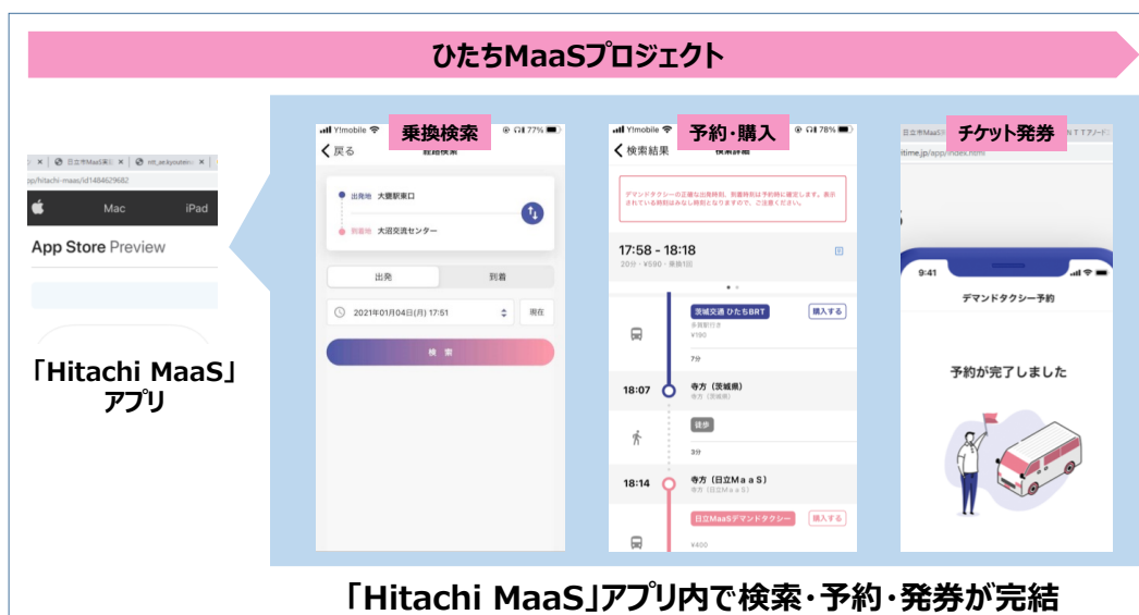
図1. 「Hitachi MaaS」アプリ

AI デマンドサービスは、利用者（複数）のリクエスト（乗車地点・目的地・乗車時刻）を受け取り、希望地点近隣の乗降場所を通るように経路を変更し、運行します。従来の固定ダイヤ・固定ルートに比べて、大幅に利便性が向上します。本サービスでは Via の AI プラットフォームを活用したオンデマンドタクシーを、ナビタイムが開発した「Hitachi MaaS」アプリから検索・予約・発券します。また、乗換検索に AI デマンドサービスを融合させることで、AI デマンドサービスが地域交通の一つとして利用者に認知され、シームレスに利用できる環境を提供します。