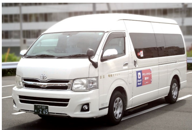
写真: 宮田・助川・成沢エリアを運行する車両