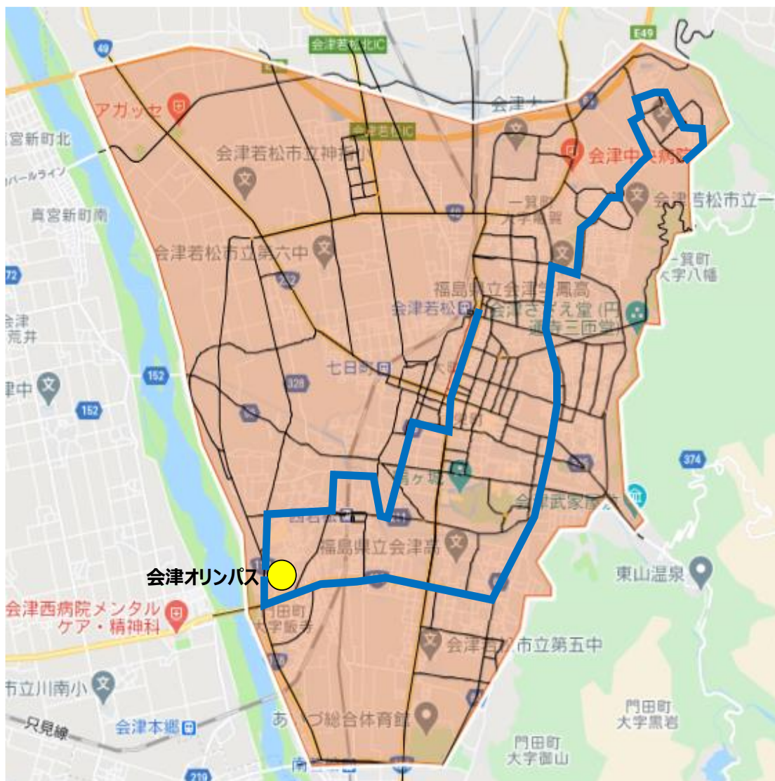
運行エリア図：定時定路線ルート（青線）とVBSの分布範囲（赤面）