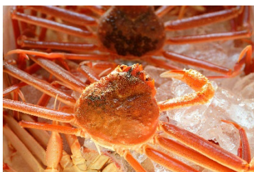
佐渡名物 紅ズワイガニ