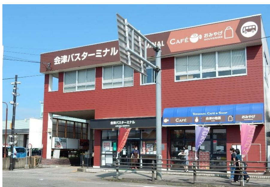
図1 実験場所 会津バスターミナル