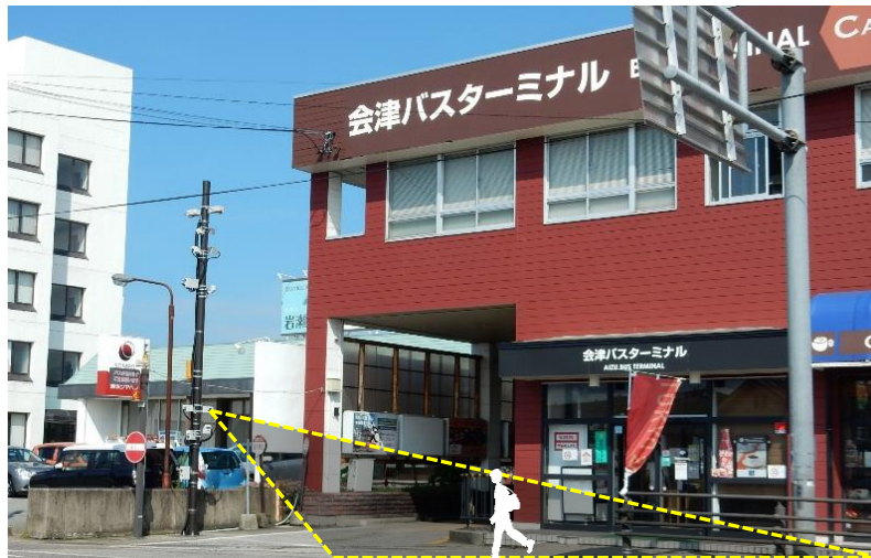
図 2 設置場所の様子と歩行者検知イメージ