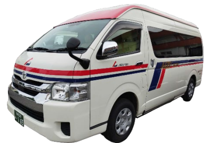
実証運行で用いる車両イメージ （ハイエースコミューター）

利用希望者が専用アプリや電話で希望する出発地、目的地、予約人数を指定して乗車予約を行うと、その予約内容や他の乗客の予約内容、道路混雑状況などに合わせてAI（人工知能）が最適な運行ルートとスケジュール（ダイヤ）を生成します。