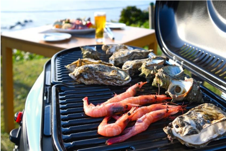
バーベキュー (イメージ)