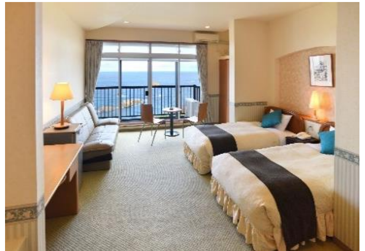
お部屋の一例 (イメージ)