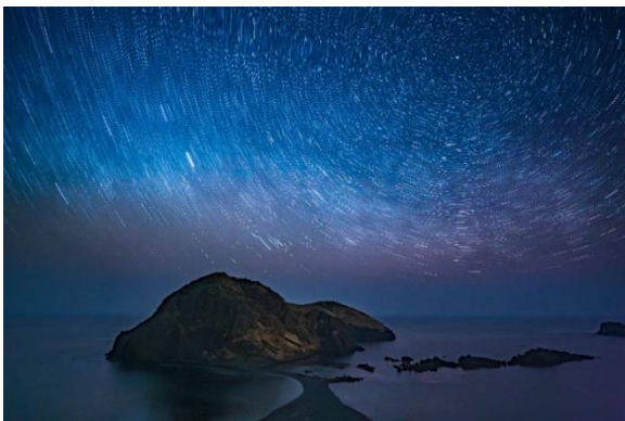
ニツ亀の星空（イメージ）