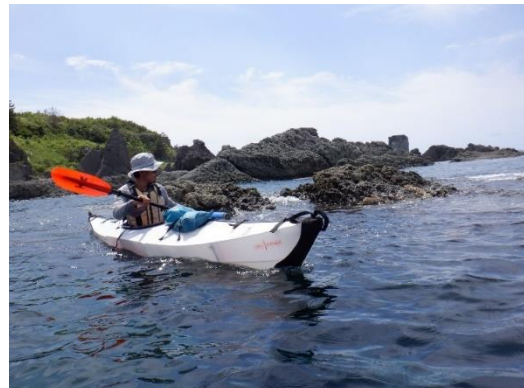
シーカヤック体験（イメージ）