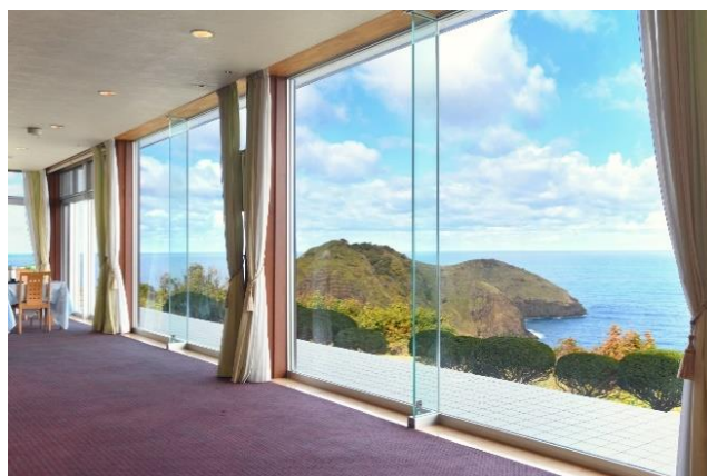
ラウンジからのニツ亀の眺め