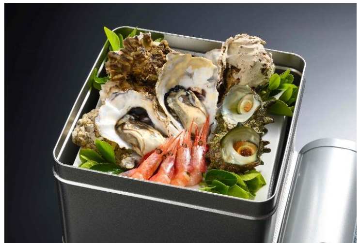
あつあつ！漁師焼き（二人前イメージ）