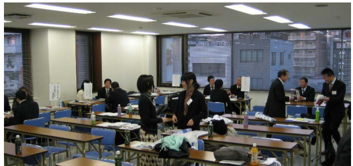
写真は昨年実施した留学情報研究ゼミナール

東京メトロ地下鉄副都心線 東京セミナー学院 池袋駅より徒歩2分 池袋駅西口から徒歩約4分(C2出口から徒歩1分) ※駐車はできません