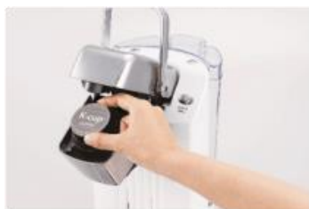
①お好みのK-Cup®を 専用マシンにセット