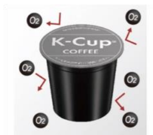
②密封により鮮度が保たれたK-Cup®