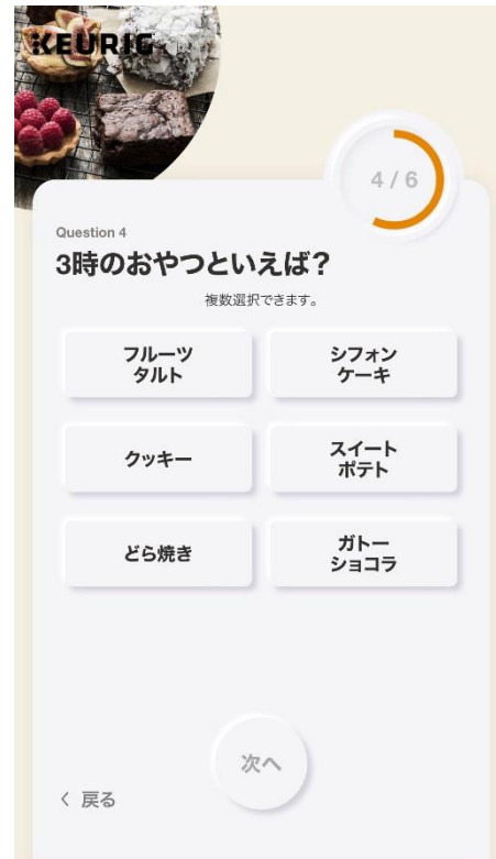
診断画面イメージ