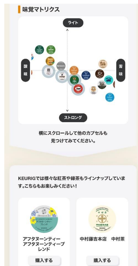
結果画面イメージ