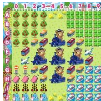
【乗り物コロカ旅なテーマ[昼]】

乗り物コロカ裏面のシリアル番号をコロニーな生活内でユーザが入力すると、各社オリジナルデザインのデジタルアイテム「●●●の模型」を獲得することができます（アイテム名が一部異なる交通事業者がございます。詳細は各交通事業者にお問い合わせください）。さらに「乗り物コロカ」入力で、各社ごとに用意された「デジタルスタンプラリー」に参加できます。指定された駅や観光地、デジタル上のお土産を集めるミッションをクリアすると、クリア数に応じて限定デジタルアイテム「乗り物コロカ旅なテーマ[昼][夕][夜]」や「乗り物コロカ旅金貨」などを獲得することができます。