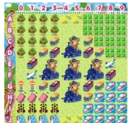
【乗り物コロカ旅なテーマ[昼]】

乗り物コロカ裏面のシリアル番号をコロニーな生活内でユーザが入力すると、各社オリジナルデザインのデジタルアイテム「●●●の模型」を獲得することができます (アイテム名が一部異なる交通事業者がございます。詳細は各交通事業者にお問い合わせください)。さらに「乗り物コロカ」入力で、各社ごとに用意された「デジタルスタンプラリー」に参加できます。指定された駅や観光地、デジタル上のお土産を集めるミッションをクリアすると、クリア数に応じて限定デジタルアイテム「乗り物コロカ旅なテーマ[昼][夕][夜]」や「乗り物コロカ旅金貨」などを獲得することができます。