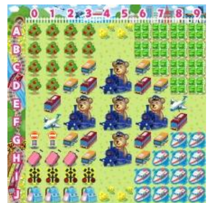
【乗り物コロカ旅なテーマ[昼]】

乗り物コロカ裏面のシリアル番号をコロニーな生活内でユーザが入力すると、各社オリジナルデザインのデジタルアイテム「●●●の模型」を獲得することができます (アイテム名が一部異なる交通事業者がございます。詳細は各交通事業者にお問い合わせください)。さらに「乗り物コロカ」入力で、各社ごとに用意された「デジタルスタンプラリー」に参加できます。指定された駅や観光地、デジタル上のお土産を集めるミッションをクリアすると、クリア数に応じて限定デジタルアイテム「乗り物コロカ旅なテーマ[昼][夕][夜]」や「乗り物コロカ旅金貨」などを獲得することができます。