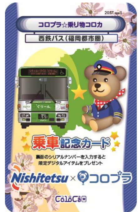
【西鉄バス (福岡都市圏)】