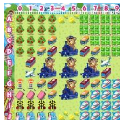
【乗り物コロカ旅なテーマ[昼]】

乗り物コロカ裏面のシリアル番号をコロニーな生活内でユーザが入力すると、各社オリジナルデザインのデジタルアイテム「●●●の模型」を獲得することができます（アイテム名が一部異なる交通事業者がございます。詳細は各交通事業者にお問い合わせください）。さらに「乗り物コロカ」入力で、各社ごとに用意された「デジタルスタンプラリー」に参加できます。指定された駅や観光地、デジタル上のお土産を集めるミッションをクリアすると、クリア数に応じて限定デジタルアイテム「乗り物コロカ旅なテーマ[昼][夕][夜]」や「乗り物コロカ旅金貨」などを獲得することができます。