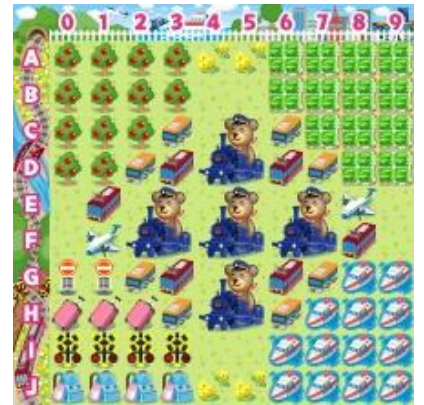
【乗り物コロカ旅なテーマ[昼]】

乗り物コロカ裏面のシリアル番号をコロニーな生活内でユーザが入力すると、各社オリジナルデザインのデジタルアイテム「●●●の模型」を獲得することができます（アイテム名が一部異なる交通事業者がございます。詳細は各交通事業者にお問い合わせください）。さらに「乗り物コロカ」入力で、各社ごとに用意された「デジタルスタンプラリー」に参加できます。指定された駅や観光地、デジタル上のお土産を集めるミッションをクリアすると、クリア数に応じて限定デジタルアイテム「乗り物コロカ旅なテーマ[昼][夕][夜]」や「乗り物コロカ旅金貨」などを獲得することができます。