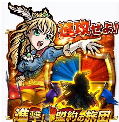
新イベント「進撃！盟約の旅団」 イメージイラスト