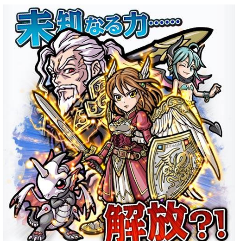
新キャラクター「天空伝」シリーズ イメージイラスト

（*1）コロプラ調べ。4月18日現在Google Playゲーム売上ランキング1位を継続中。