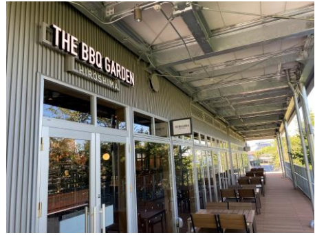
2階店内受付画像 / 2階 店内画像/ 2階 店頭画像

3つ目はBBQエリアの上階にあるテラスエリア(屋外) テーブル&イスのカジュアルスタイル で電気グリルをご用意。屋外の開放感と 設備が整った快適さを同時に体験できる エリアとなっています。