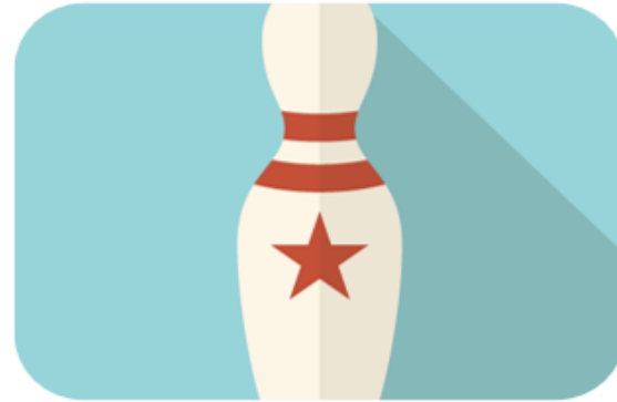
アミューズメント 屋内遊戯施設