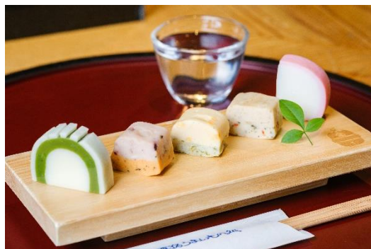
フィッシュプロテインバーお試しセット 価格:500円(税込)ドリンク付き 販売店舗:鈴なり市場 かまぼこバー