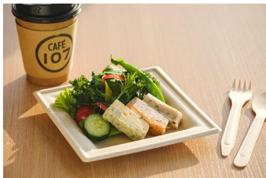
フィッシュプロテインバー3種とサラダのセット 価格:500円(税込) 販売店舗:CAFE107

お魚たんぱくを手軽に補給できるフィッシュプロテインバーは、体づくりに励むすべての人たちに召し上がっていただきたい一品です。フィッシュプロテインバーを気軽にお試しいただけるよう、「鈴廣カラダ WEEK」期間限定のメニューを各施設で提供いたします。