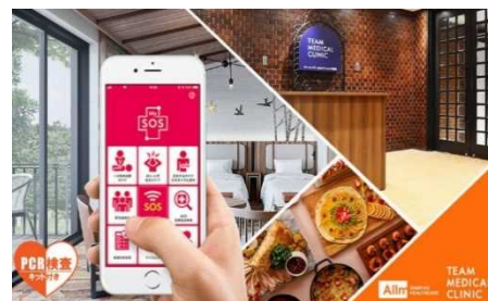
「PCR検査付き宿泊プラン」