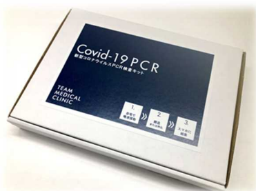
駅ナカ・コンビニ「トモニー」 で発売するPCR検査キット

具体的な取り組みは別紙のとおりです。今後も西武グループとアルムは、感染症対策をしっかりと講じながら、「安全・安心」を最優先に各種事業を協力して展開し、両社連携による付加価値の提供に一層繋げていけるよう、努めてまいります。