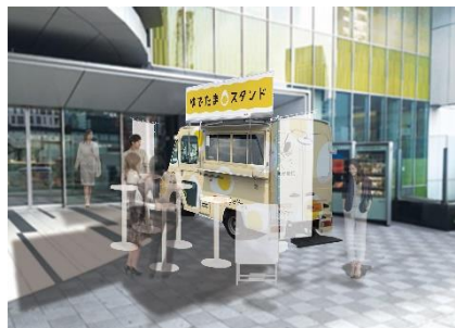
東京会場（渋谷ヒカリエ）イメージ

アクセス： 京王井の頭線「渋谷駅」と2階連絡通路で直結 東京メトロ銀座線「渋谷駅」と1階で直結 東急線・地下鉄線「渋谷駅」B5出口直結