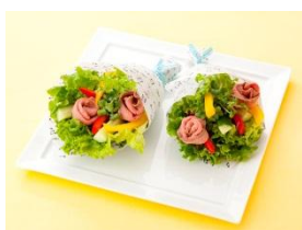
ローストビーフとスティック野菜のブーケサラダ

「ブーケサラダ」のほかにも「母の日特集」のレシピを公開しています。今年の母の日は、手作りサラダで日頃の感謝の気持ちを伝えてみてはいかがでしょうか。