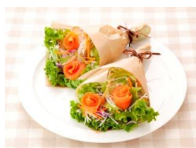
スモークサーモンと水菜と大根のブーケサラダ