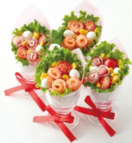
新しいレシピ モッツアレラとプチトマトのカップブーケサラダ