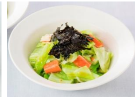
カニカマとキャベツの和風サラダ (和風醤油 黒酢入り使用)