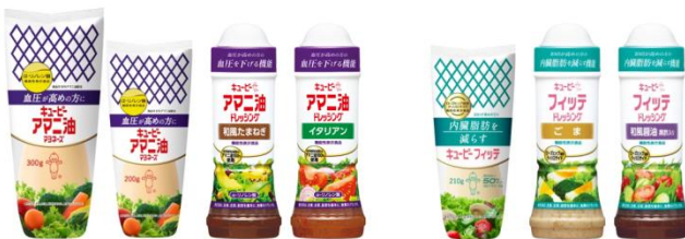
㊤アマニ油マヨネーズとアマニ油ドレッシング、㊦フィットとフィットドレッシング

※3 キューピーアヲハタニュース 2017 No.35 、※4 キューピーアヲハタニュース 2021 No.65