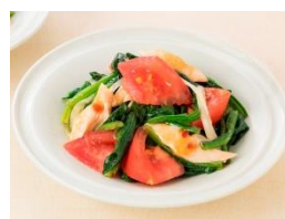
ほうれん草とトマトのあえサラダ (和風たまねぎ使用)

ハーブとスパイスに、赤ワインの風味を生かしたビネガーを合わせ、深みのあるイタリアンドレッシングに仕上げました。