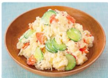
エッグケアのポテトサラダ

※4 本品は卵を含む商品と共通の設備で生産していますが、製造前に十分な洗浄を行っています。 また、製造日ごとに卵アレルギーの検査を行っています。