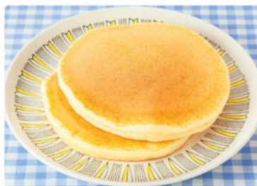
卵を使わない！ホットケーキ