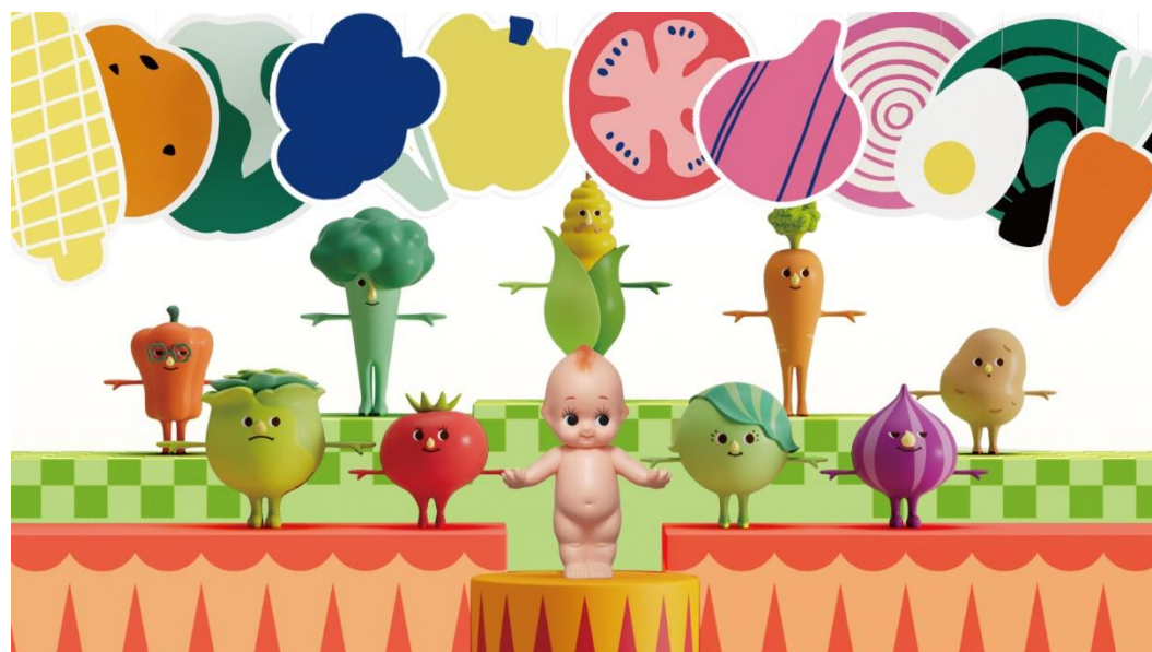
新オープニング・エンディング(イメージ画像)

さらに2023年1月4日(水)から番組のオープニング・エンディングを刷新します。「おもちゃの兵隊のマーチ」をBGMに、バブリーダンスで話題となった振付師akaneさんの振り付けによる新たなダンスを、キューピーとヤサイな仲間たちが踊ります。