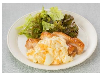
カキフライのねぎレモンタルタルソース 照り焼きチキンの甘酢らっきょうタルタルソース