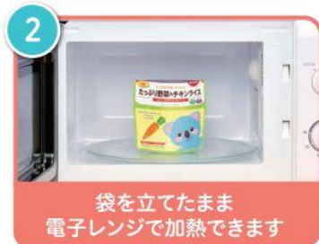
2 袋を立てたまま 電子レンジで加熱できます