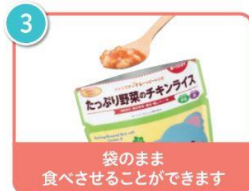
3 袋のまま 食べさせることができます

10 秒の加熱（500W～600W）で人肌程度に温まります。パウチは底が広く自立性があるので、皿などに移し替えることなく、器としても利用できます。切り取り口（セーフティノッチ）を上下 2 カ所に付けたことで、食べ進めてさらに下部で切り取ると、パウチをコンパクトに、より安定した形状にでき、食べさせやすくなります。また、パッケージに記載の QR コード※1 を読み取ると、使用方法の動画を見ることができます。温めずにそのままでもおいしく食べられるため、外出にも便利です。