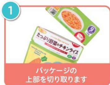
1 パッケージの 上部を切り取ります