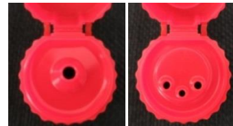
㊤従来の1つ穴の細口、㊦3つ穴キャップ

同時に出したマヨネーズがくっつかないように、それぞれの絞りは、最大限に離しました。全ての絞りは正面側にあり、中央の絞りをやや手前に配置しています。