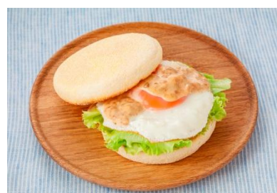
エッグてりやきバーガー(てりやきソース&マヨ)