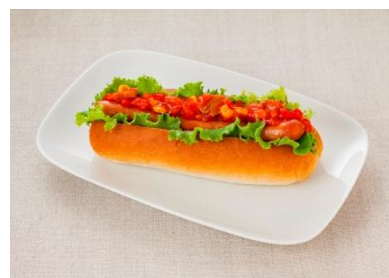
ピザドッグ(バジル香るピザソース)