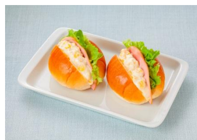
ロールパンサンド(コーン&マヨ)