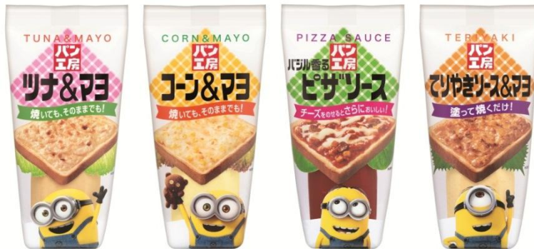
© Universal City Studios LLC. All Rights Reserved.

キューピー株式会社(本社:東京都渋谷区、代表取締役 社長執行役員:長南 収、以下キューピー)は、パンに塗ったり挟んだりするだけで、簡単に具材たっぷりの惣菜パンが楽しめる「パン工房」から、「てりやきソース&マヨ」を新発売します。人気の定番アイテム「ツナ&マヨ」と「コーン&マヨ」は味を刷新し、賞味期間を7ヵ月から10ヵ月に延長します。併せて、子どもから大人まで、大人気のキャラクター「ミニオン」を採用したパッケージデザインを全品リニューアルし、引き続き、若年層へのさらなるファン拡大を図ります。