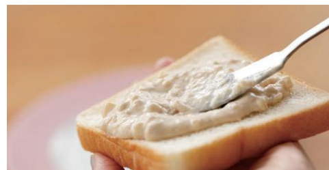
パンに塗りやすい、なめらかな仕立て

忙しい朝は、満足感のある食事は食べたいけれど、作る時間も食べる時間もお皿を洗う時間も節約したい。そんな時に、「パン工房」とパンさえあれば、手軽にボリューム満点の惣菜パンが出来上がります。