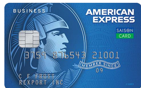
【カード券面デザイン】

本カードのコンセプトは、「ビジネスの効率化」。ビジネスオーナーが持つ課題、「資金調達」「経費削減」「業務効率向上」のソリューションとなるサービスを付帯することで、中小企業や個人事業主、また 1,000 万人を突破したとされるフリーランス層の B2B 決済のキャッシュレス化をサポートいたします。