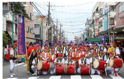
映画『なんでかね～鶴見 ガーエーにはまだ早い』