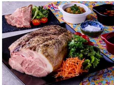
土日祝：あぐー豚の低温ロースト