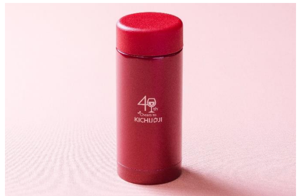
ホテル開業40周年記念オリジナルステンレスボトルイメージ

吉祥寺東急 REI ホテルでは、お客様およびホテルスタッフの安全と健康を第一に新型コロナウイルス感染予防対策に最善を尽くして取り組んでまいります。詳しくは公式ウェブサイトをご覧ください。