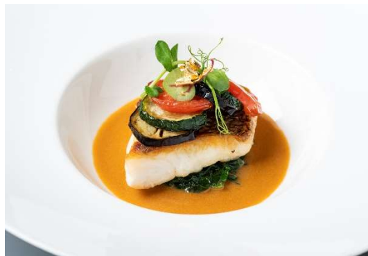
ディナー料理(イメージ)