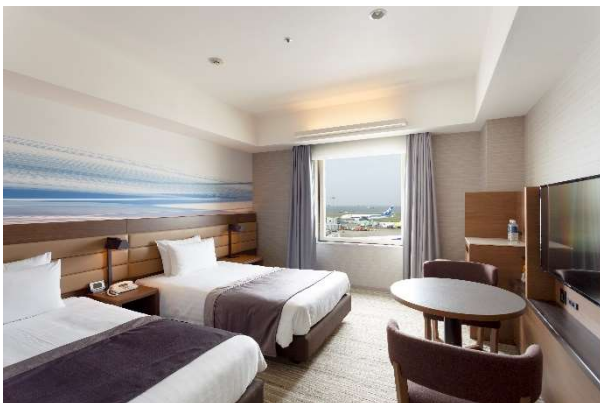
滑走路ビュー客室(イメージ)

2023年は是非当ホテルからスタートしていただき、幸多き1年の願いを翼にのせて初日の出を拝む、日常では味わえない特別な時間をお過ごしください。