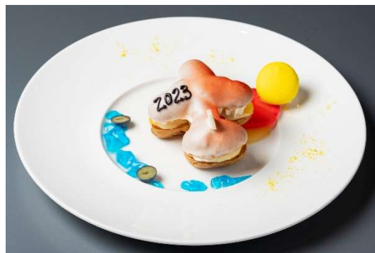
飛行機シュー初日の出 Ver.(イメージ)