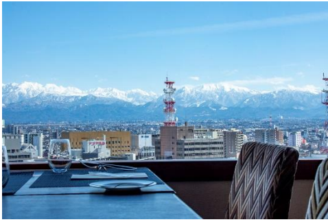
レストラン「リコモンテ」