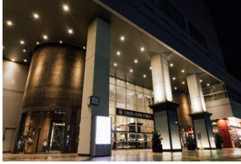
ホテルエントランス